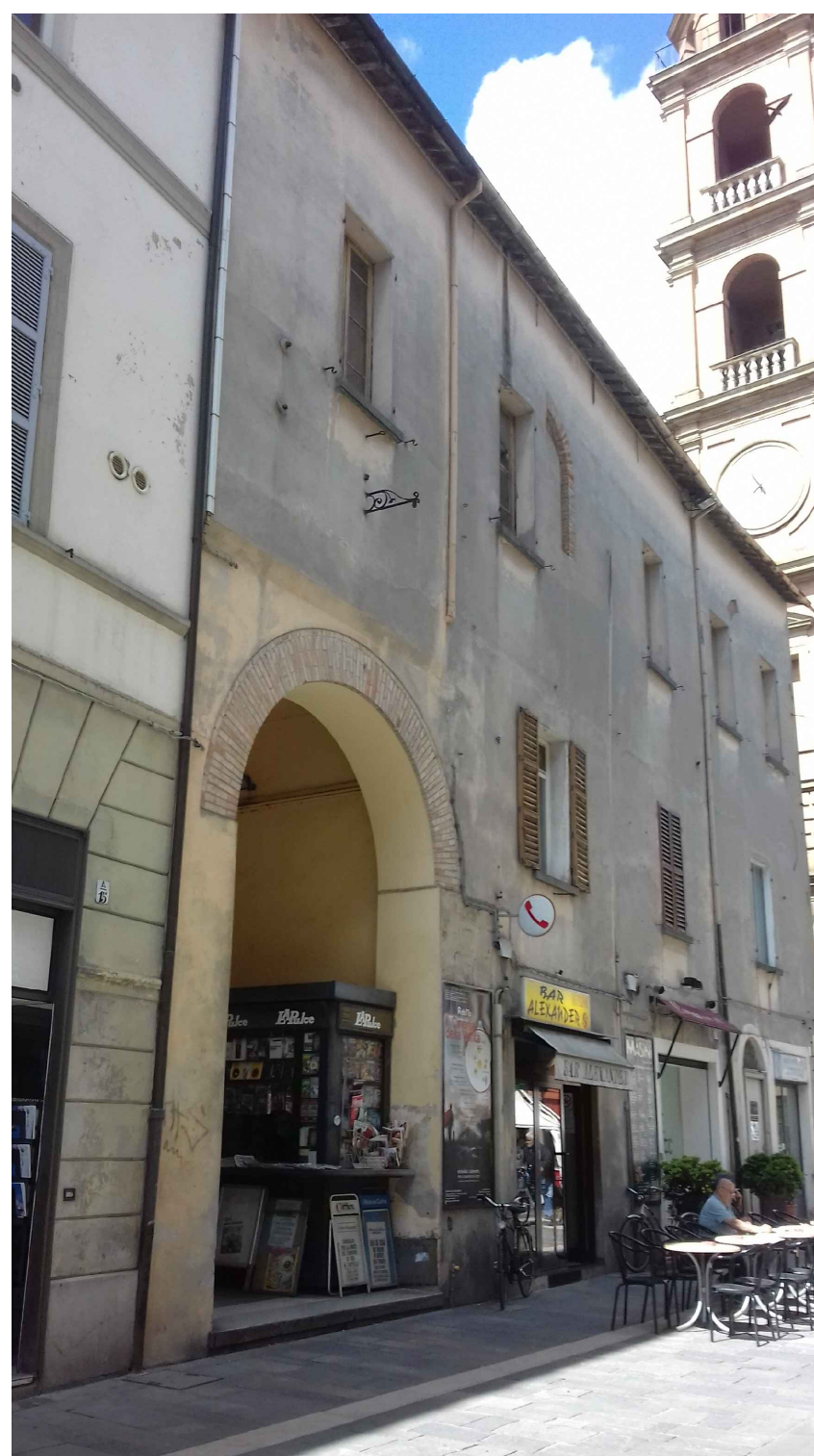
FOTO - EX ALBERGO CORONA E TORRE CIVICA