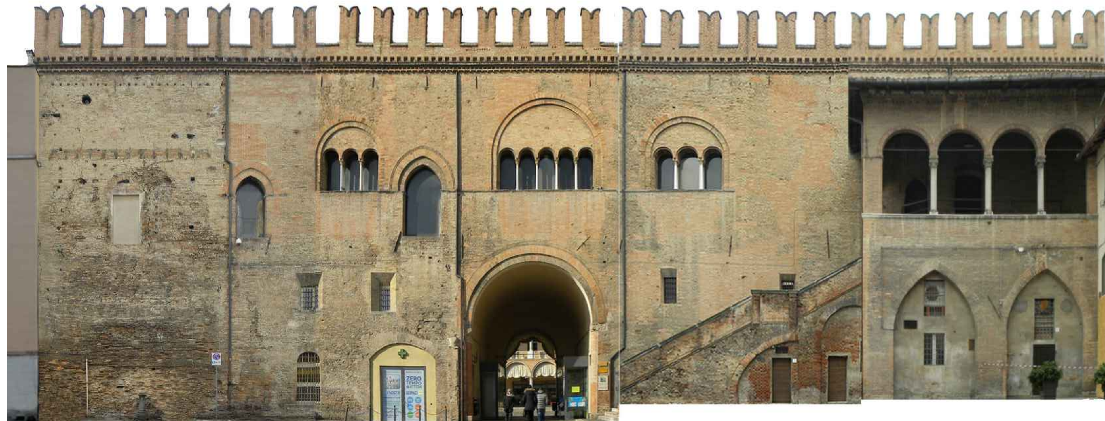
PIAZZA MARTIRI DELLE LIBERTA'